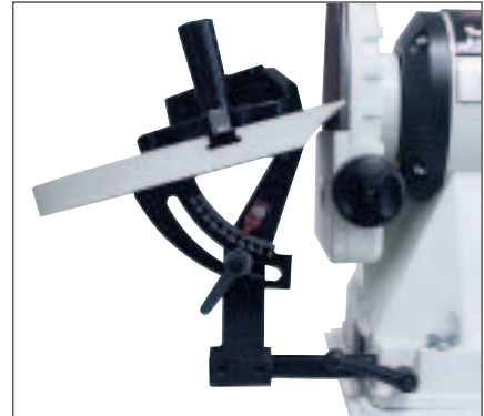
Graugußtisch schrägstellbar mit Stopps bei 90° und 45°