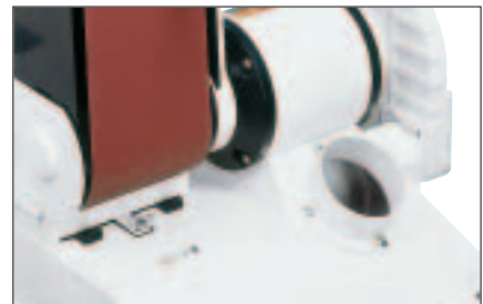
100-mm-Absaugstutzen für beide Schleiffunktionen