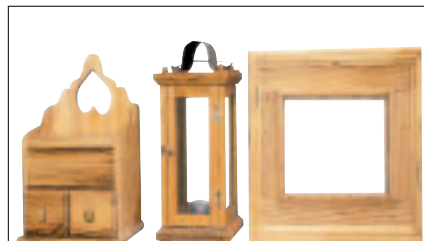
Schleifen von Kanten auch in beliebigen Winkeln möglich